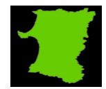
三浦の故郷の秋田です★

ゴーヤサンサン ナニコレー 03-5833-7250 FAX 03-5833-7251